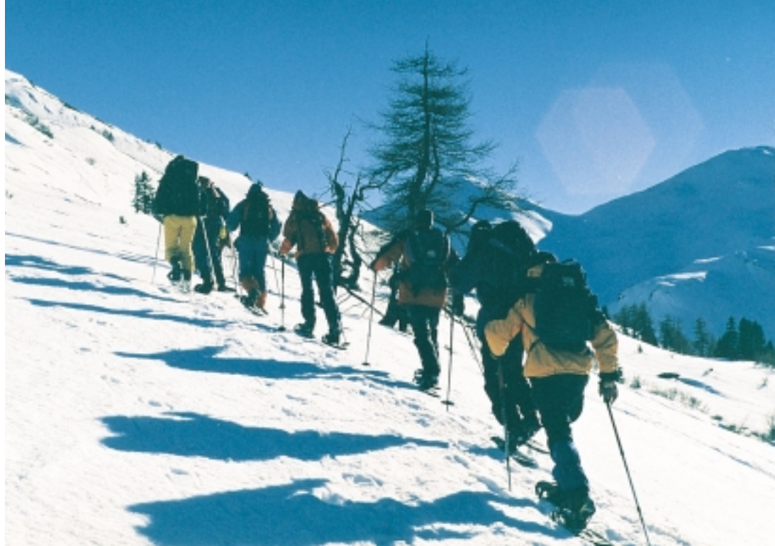
Winterliches Bergwandern auf Schneeschuhen - eine lohnende Alternative.

1. Satz: Jugend-, Schüler- und Lehrlingsgruppen – von allegro, über triste, manchmal sogar pesante bis hin zum hoffentlich grandiosen Finale. Kurz zum Ablauf: In diesen Tagen wird an einem für die TeilnehmerInnen wichtigen Thema gearbeitet. Das Thema und entsprechende Entwicklungspotentiale werden durch speziell dafür vorbereitete Situationen, denen sich die Gruppe stellt, deutlich aufgezeigt. Solche Situationen, um nur einige zu nennen, können Problemlösungen auf Zeit und Kommunikationsabläufe unter erschwerten Bedingungen sein. Das Ziel: Anhand der sichtbar gemachten Abläufe werden Verbesserungsmöglichkeiten erarbeitet und – besonders wichtig – Transferschritte überlegt. Wie nehmen wir das